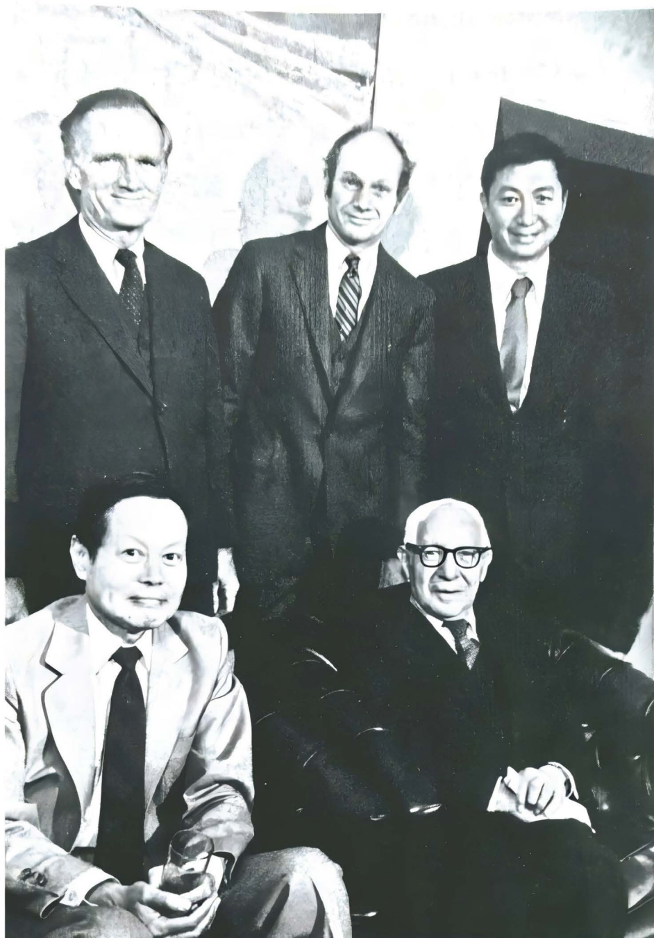
图 2.4 1976 年，杨振宁与诺贝尔物理学奖得主伊西多·艾萨克·拉比（前排右一）、瓦尔·洛格斯登·菲奇（后排左一）、詹姆斯·沃森·克罗宁（后排中）、丁肇中（后排右一）